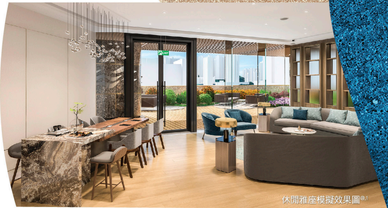
休閒雅座模擬效果圖 1