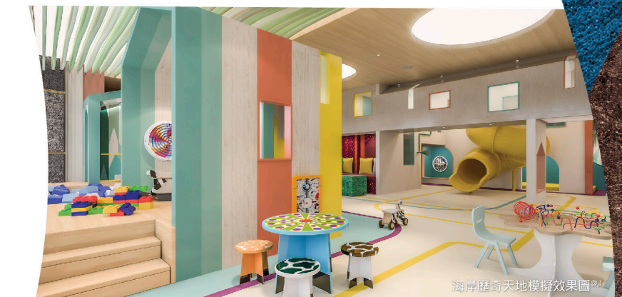
海岸歷奇天地模擬效果圖 1