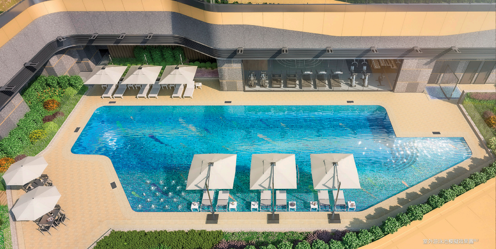
室外游泳池模擬效果圖 1